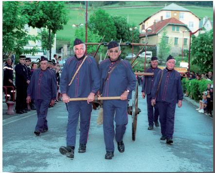
Les vétérans du corps de Seyne défilent armés et en tenue avec la pompe à bras à l'occasion du congrès départemental du 26 mai 2001