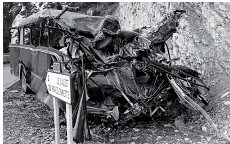
23 mars 1980 - En dérapant sur le verglas, un car du ski-club de la base d'Istres défonce le parapet du pont du Pas de la Tour et s'écrase au fond du ravin. Bilan : 17 morts et 4 blessés. Une intervention difficile sur tous les aspects et qui reste ancrée dans la mémoire des pompiers de Seyne.

De nouvelles tenues et matériels étaient également arrivés à la Compagnie qui avait été réorganisée conformément au décret du 13 août 1925 et comprenait alors 20 volontaires. La Compagnie ne disposait pas de locaux et s'organisait comme elle pouvait : le Delahaye était garé à la maison Aubert, rue du Barri et le Renault dans une remise municipale située près de l'Eglise Notre-Dame de Nazareth. Le démarrage des moteurs à la manivelle constituait toujours de grands moments et les pompiers poussaient souvent les camions à la pente quand elle ne suffisait pas !